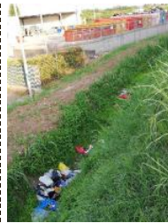
I rifiuti nei pressi dell'ecocentro

Lunedì mattina i dipendenti comunali hanno prontamente