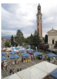
Un'edizione della Festa

A cominciare sarà l'Associazione Cineforum Idea Nove, che per celebrare il proprio cinquantennale di attività propone nelle serate di martedì e giovedì la nona edizione del "Ceramica film festival" in sala polivalente (inizio proiezioni alle 21). Nelle due serate il Cineforum Idea metterà nel proiettore pellicole di alto valore documentale per la cultura ceramica in omaggio alla figura di Alessio Tascia: si va dal "Raccolto d'inverno" del regista Riccardo De Cal (2010) al "Rivarotta" di Giulia Ciniselli (1989) e "La mura" di Ludovico Barettoni (1991); programmate anche il "Terre rare" di Toni De Gregorio (1997) e "Mar de fang" di Luis Ortés e August