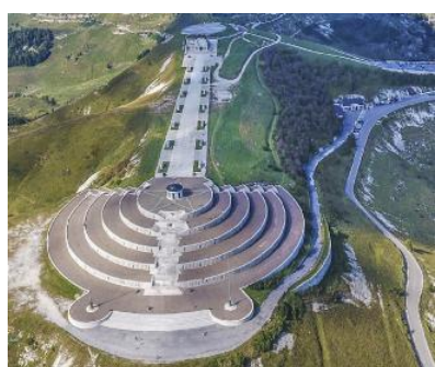
Il sacrario di Cima Grappa

«Questo progetto - continua Cunial - è un riconoscimento dovuto a un simbolo nazionale tra i più suggestivi, legato alla nostra storia e alla memoria dei caduti e, al tempo, un impegno di valorizzazione di un intero territorio da un punto di vista paesaggistico, turistico, agricolo, sociale e culturale, nonché un passo importante anche